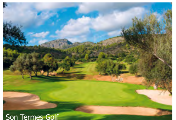
Son Termes Golf

Geplanter Reiseleiter Oscar Sastre (Änderungen vorbehalten!)