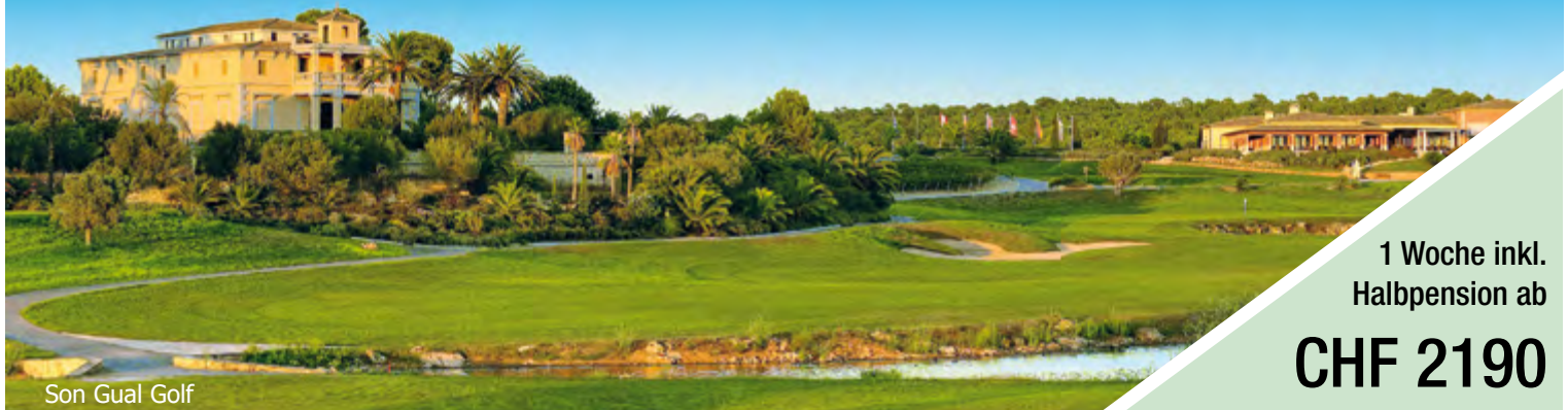
Son Gual Golf