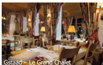
Gstaad – Le Grand Chalet GSTAAD – LE GRAND CHALET **** CRANS-MONTANA – DE L'ETRIER ****