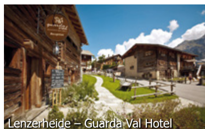
Lenzerheide – Guarda Val Hotel

LENZERHEIDE – BESTZEIT *** ST. MORITZ – CRESTA PALACE ****