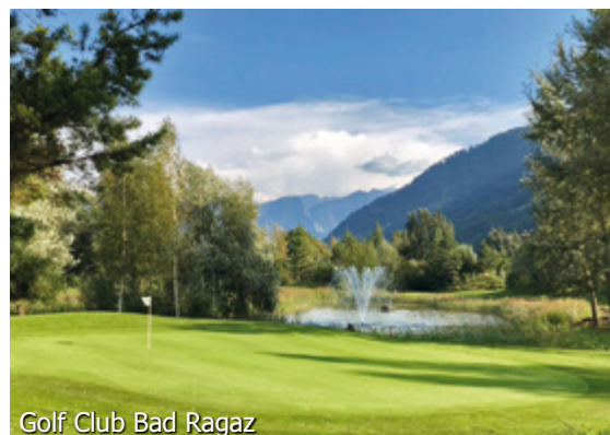
Golf Club Bad Ragaz