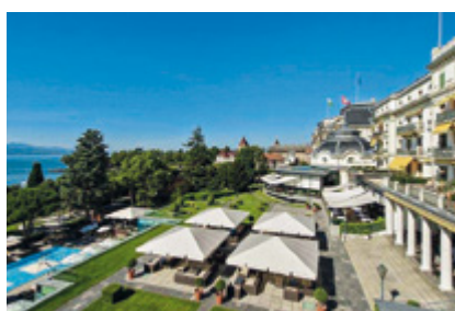
HÔTEL BEAU-RIVAGE PALACE *****