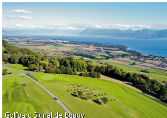
Golfparc Signal de Bougy