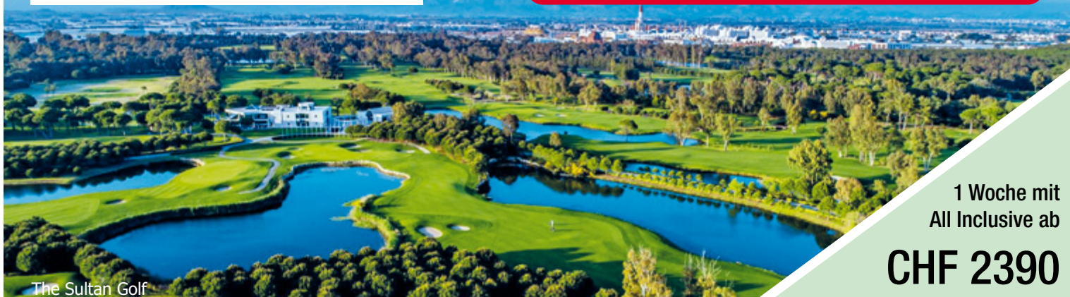
The Sultan Golf

PLAUSCH- & TURNIERWOCHE 29. OKT – 05. NOV 2021