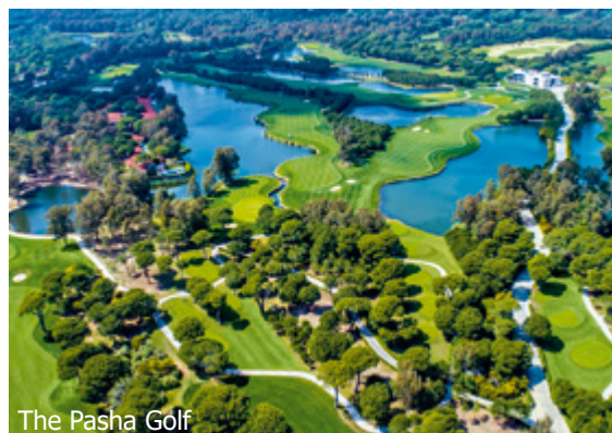
The Pasha Golf

WICHTIG: Limitierte Anzahl Flugplätze zu oben stehenden Konditionen. Ist die berechnete Buchungsklasse nicht mehr verfügbar, behalten wir uns vor, den Flugzuschlag aufzurechnen. Früh buchen lohnt sich! Org430