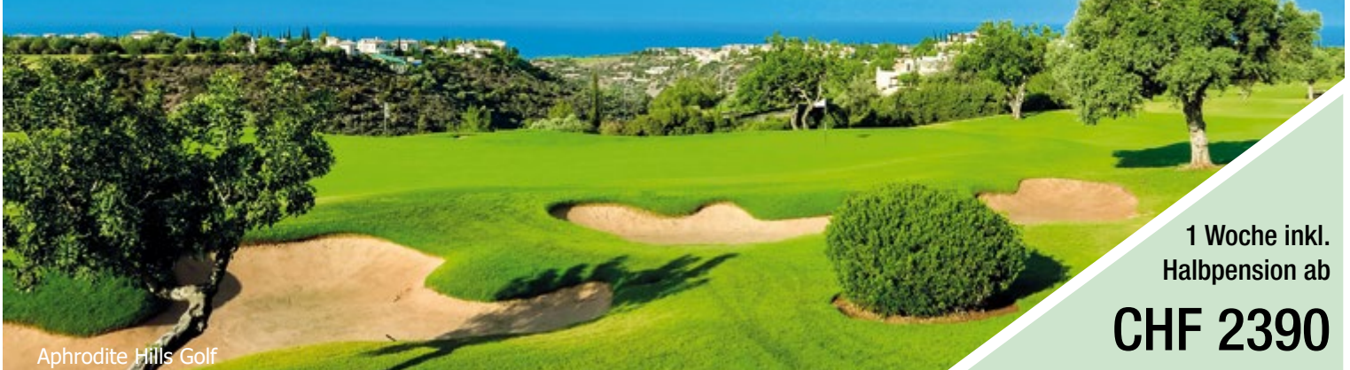
Aphrodite Hills Golf

PLAUSCH- & TRAININGSWOCHE 20. FEB – 27. FEB 2022