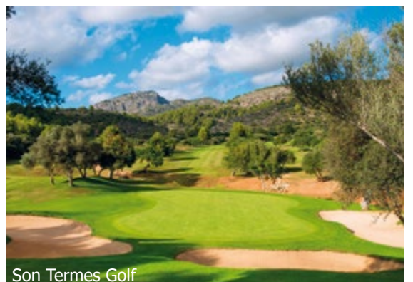
Son Termes Golf

Annullierungs- und SOS-Versicherung ab 75 Dossiergebühr 50