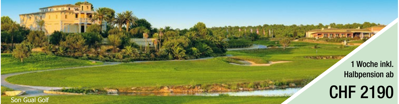
Son Gual Golf