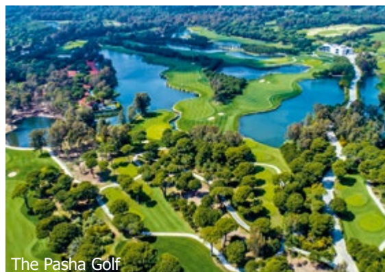
The Pasha Golf

WICHTIG: Limitierte Anzahl Flugplätze zu oben stehenden Konditionen. Ist die berechnete Buchungsklasse nicht mehr verfügbar, behalten wir uns vor, den Flugzuschlag aufzurechnen. Früh buchen lohnt sich! 0sh370