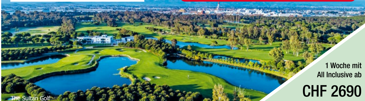
The Sultan Golf

PLAUSCH- & TURNIERWOCHE 28. OKT – 04. NOV 2022