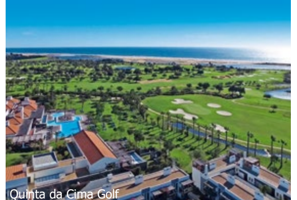
Quinta da Cima Golf

WICHTIG: Limitierte Anzahl Flugplätze zu oben stehenden Konditionen. Ist die berechnete Buchungskategorie nicht mehr verfügbar, behalten wir uns vor, den Flugzuschlag aufzurechnen. Früh buchen lohnt sich! 1tb580