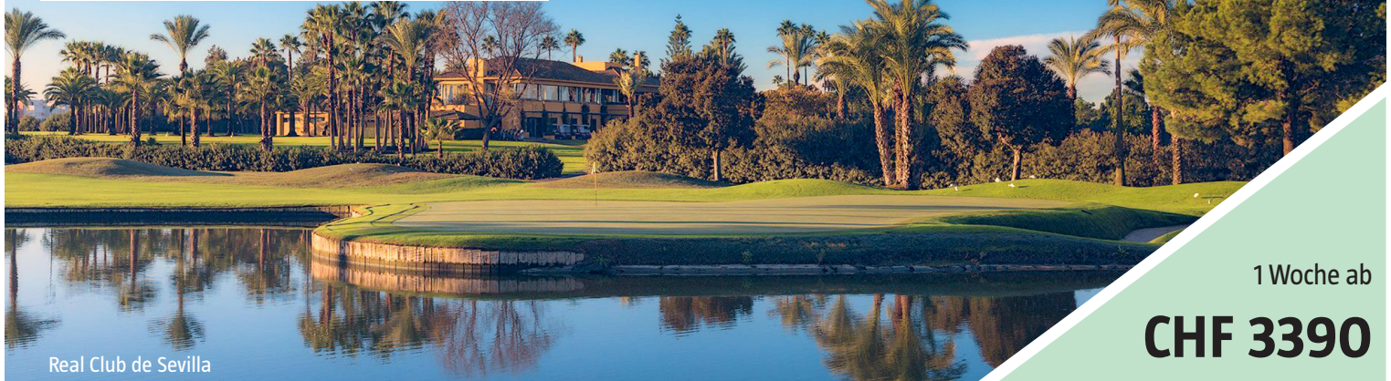
Real Club de Sevilla

NEUJAHRS-GOLFWOCH 27. DEZEMBER 2024 – 3. JANUAR 2025