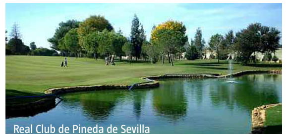
Real Club de Pineda de Sevilla