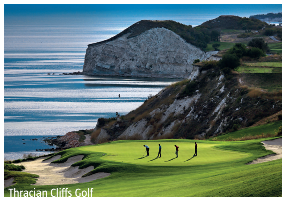
Thracian Cliffs Golf