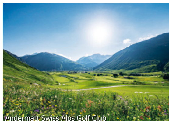
Andermatt Swiss Alps Golf Club