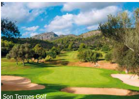
Son Termes Golf