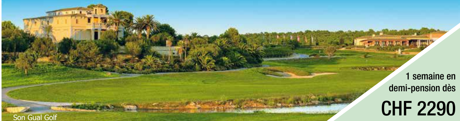
Son Gual Golf

SEMAINE DE TOURNOIS du 25 mars au 1 avril 2023