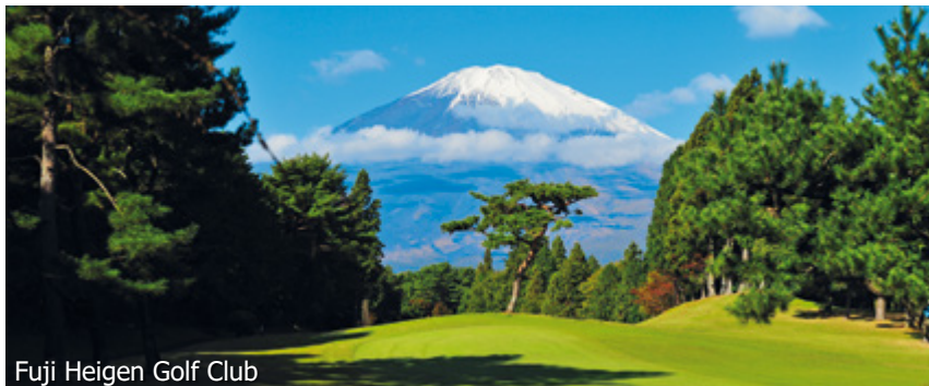
Fuji Heigen Golf Club