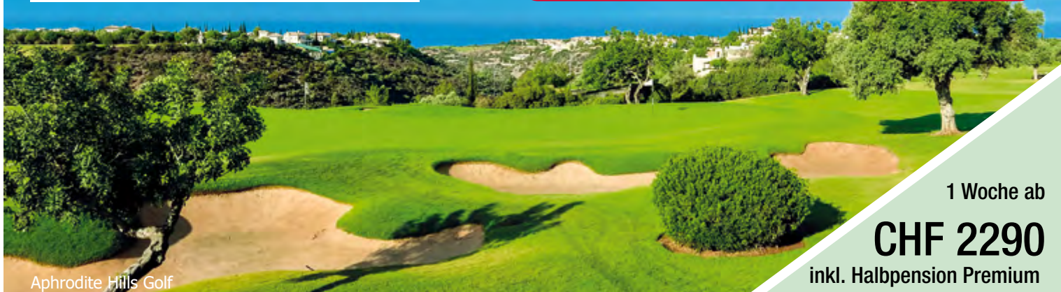
Aphrodite Hills Golf

1 Woche ab CHF 2290 inkl. Halbpension Premium