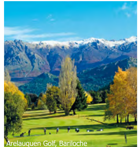
Arelauquen Golf, Bariloche