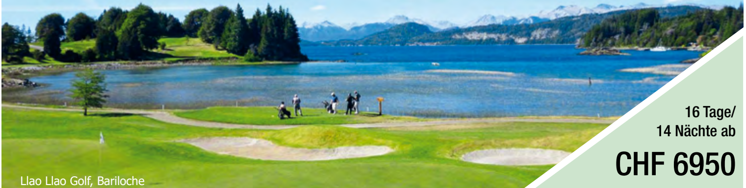
Llao Llao Golf, Bariloche