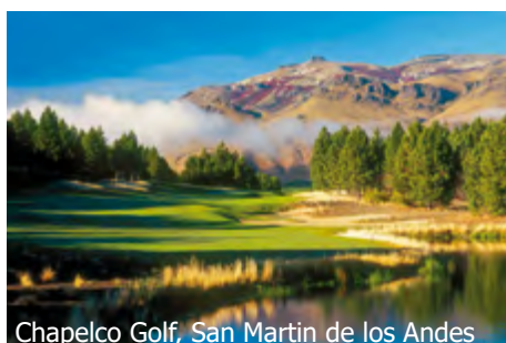
Chapelco Golf, San Martin de los Andes