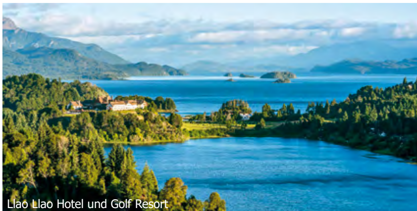
Llao Llao Hotel und Golf Resort