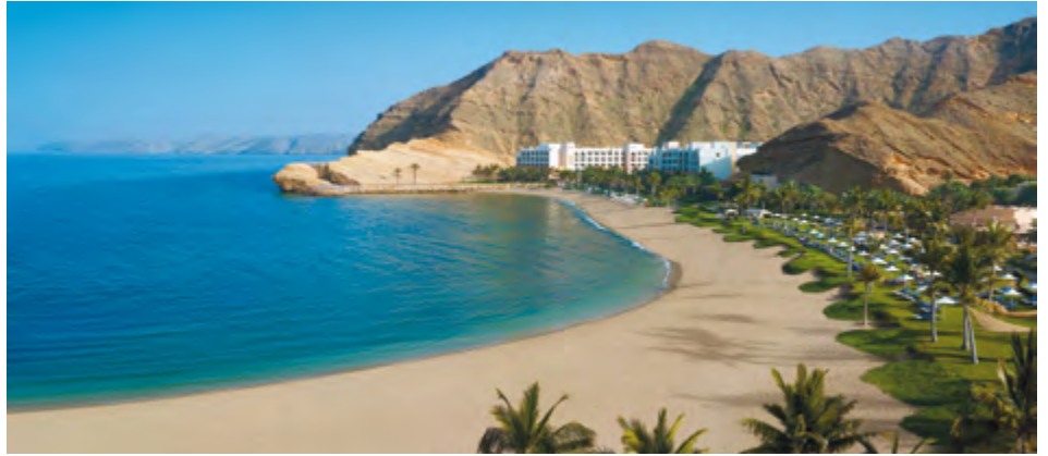
Strand vor dem Al Bandar (im Hintergrund Al Waha)