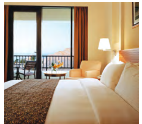
Superior Sea View Zimmer